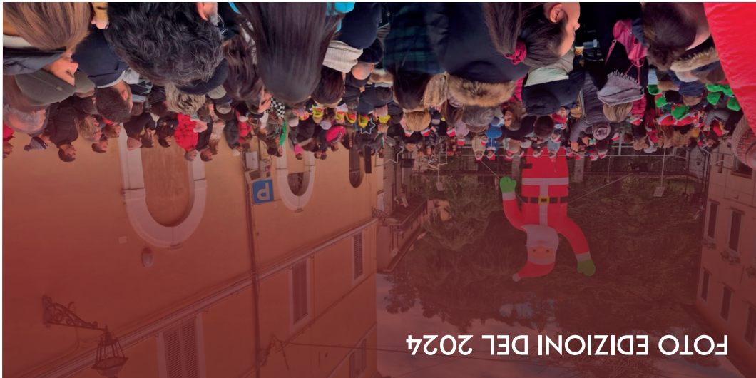
FOTO EDIZIONI DEL 2024